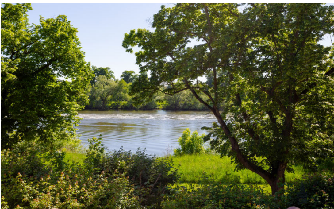
Terrassenausblick auf den Main