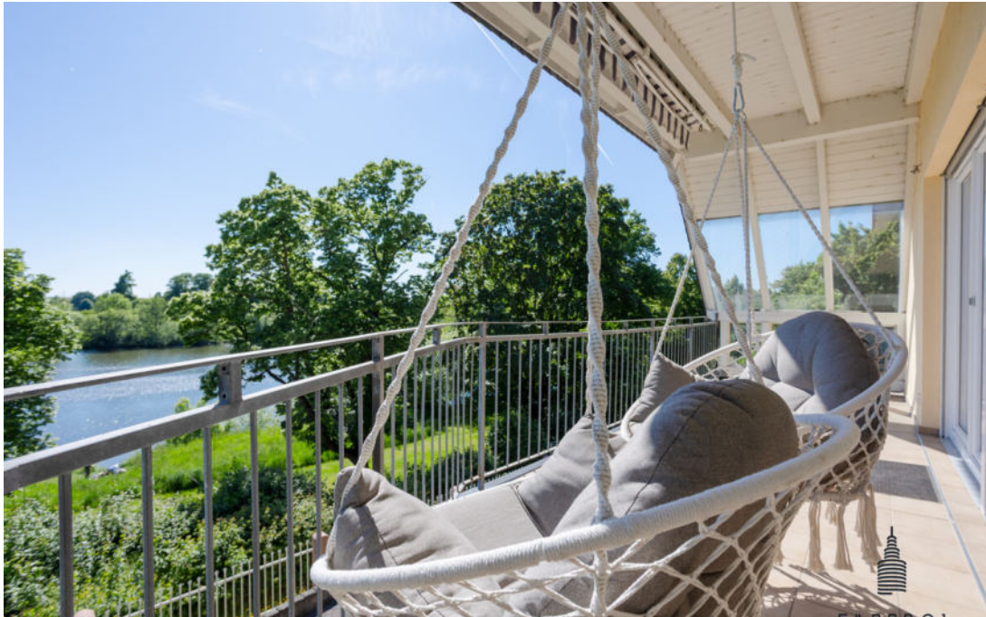
Balkon mit Mainblick