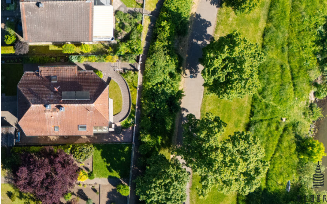
Luftbild des Anwesens