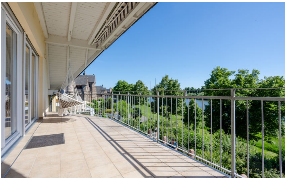
Balkon mit Mainblick