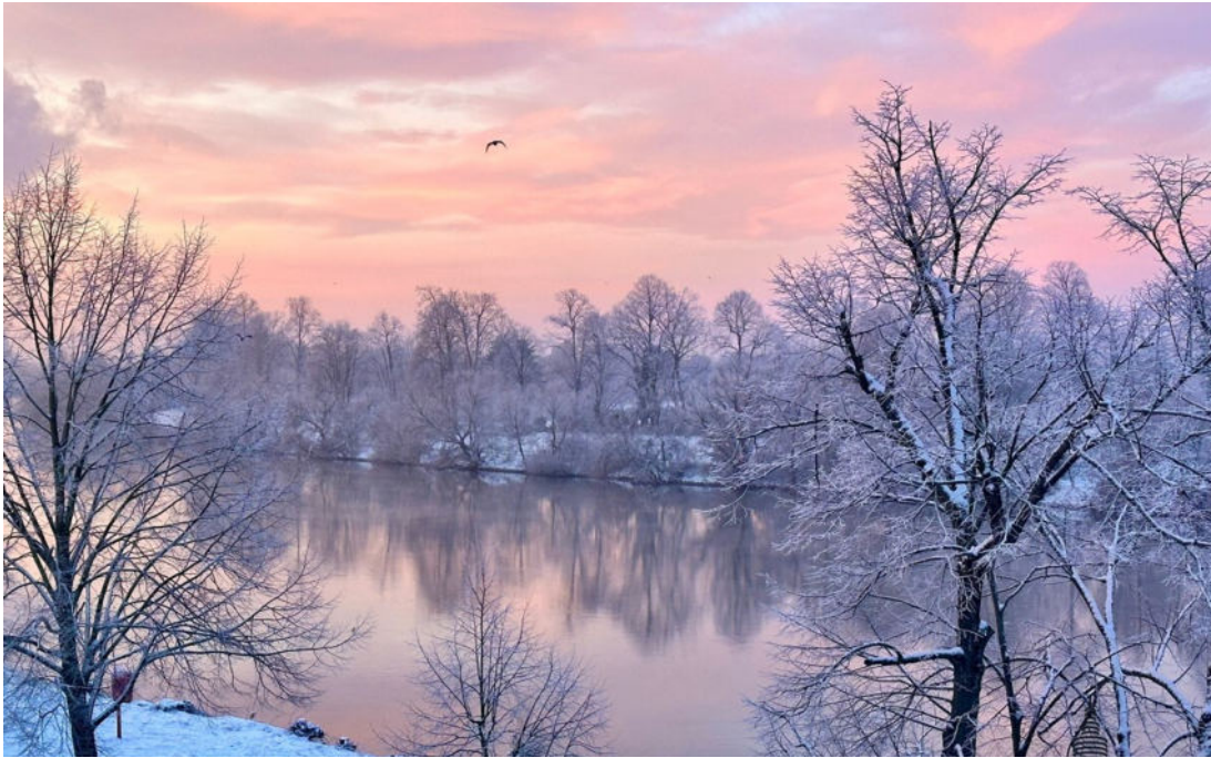
Balkonblick im Winter